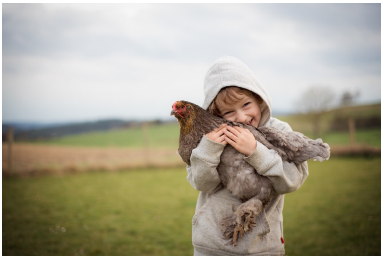
3. Hautnah die Landwirtschaft erleben wird beim Projekt Stallvisite möglich