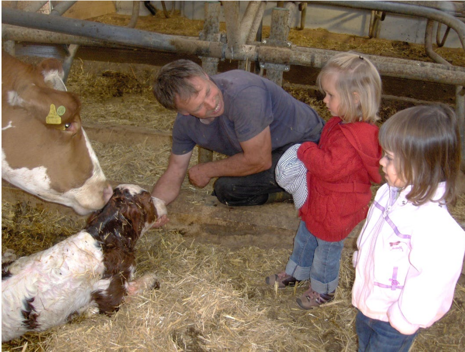
4. Hautnah die Landwirtschaft erleben wird beim Projekt Stallvisite möglich