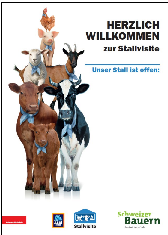
1. Willkommenstafel mit individuellen Öffnungszeiten