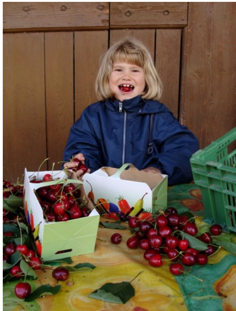
5. Hautnah die Landwirtschaft erleben wird beim Projekt Stallvisite möglich